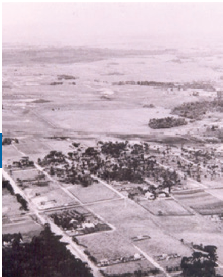
Vista Aérea de São José dos Pinhais. Década de 1940 (À esquerda, ao alto, estão as pistas da base aérea de Afonso Pena, hoje, Aeroporto Afonso Pena)

Essa capacidade de registrar vastas regiões as torna essencial para diversas áreas, como o planejamento urbano, a pesquisa científica e, também, a preservação do patrimônio histórico.