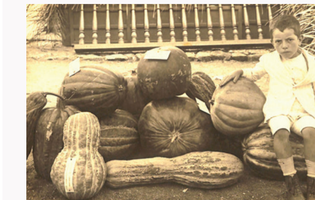
Criança ao lado de algumas morangas durante Exposição Regional de São José dos Pinhais