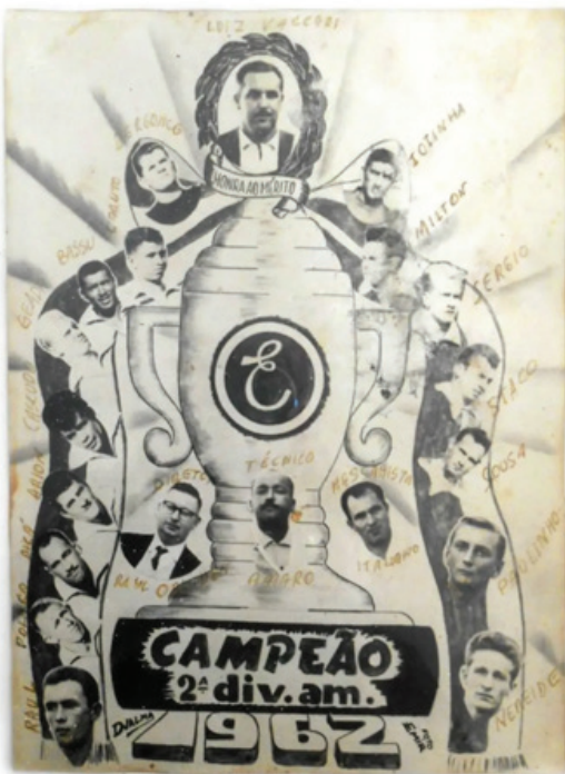
Ilustração do Esperança Futebol Clube, com a taça de campeão de 1962 e fotos dos jogadores do elenco. 1962.

Essa capacidade de registrar vastas regiões as torna essencial para diversas áreas, como o planejamento urbano, a pesquisa científica e, também, a preservação do patrimônio histórico.